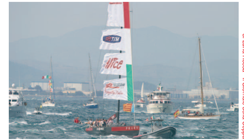
www.lunaroosachallenge.com è il sito dove trovare tutti i numeri arretrati di Luna Rossa - Il Giornale della Coppa

LUNA ROSSA, IL GIORNALE DELLA COPPA - PROGETTO, DESIGN & PUBLISHER: MICHELE CONCIN@HOTMAIL.COM CON LUNA ORLANDI E TOMMASO ORLANDI - © COPYRIGHT GOTHAM SRL - ITALY - 20100 MILANO - 8, VIA DEI FRATTI, PRINTED: JMBENTINI LORRIS, VALENCA - D.L. V.4208-2007