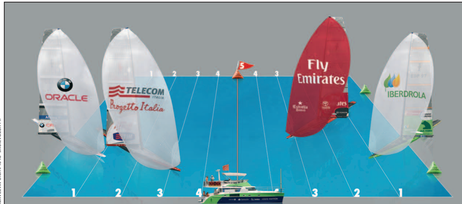
ILLUSTRAZIONE DI CLAUDIO MAZZANTI

IN EACH SEMI FINAL MATCH THE FIRST CHALLENGER TO WIN FIVE POINTS, ONE POINT PER WIN, ADVANCES TO THE LOUIS VUITTON CUP FINAL.