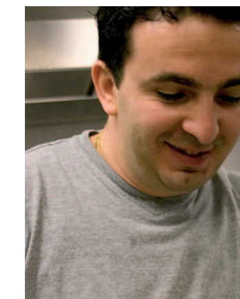
ALLA BASE IN CUCINA