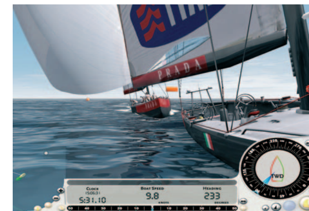
VIRTUAL SKIPPER LA REGATA