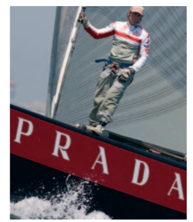
ALLA BASE LA TELEMETRIA

Each challenger races each of the others once this round. Two points per win.