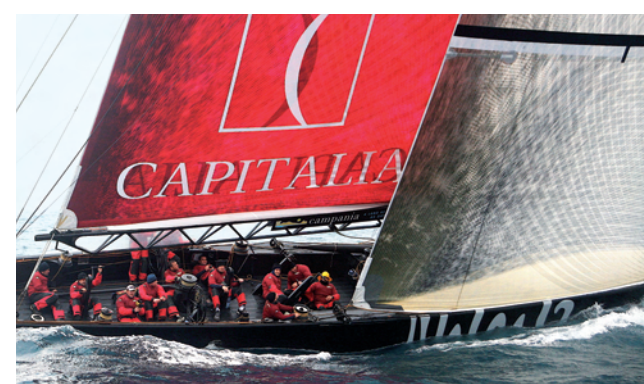
Promossi: da oggi i mascalzoni si sono svegliati nel club dei magnifici quattro!

l'albero nuovo, rotto e aggiustato ma, non ancora pronto, è stato un atto di coraggio. Nella seconda serie di regate, in sala stampa c'è stato un momento di inatteso stupore,