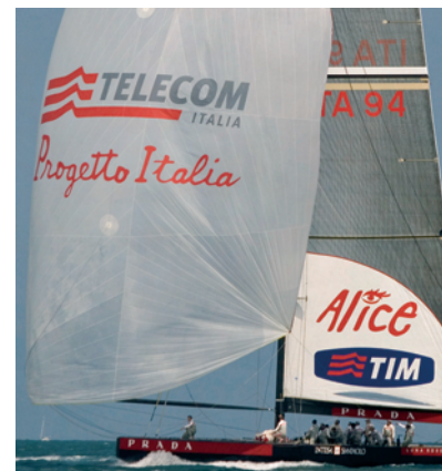
BRAVI RAGAZZI! IL BUON INIZIO DI LUNA ROSSA

Each challenger races each of the others once this round. Two points per win. * Awarded Redress